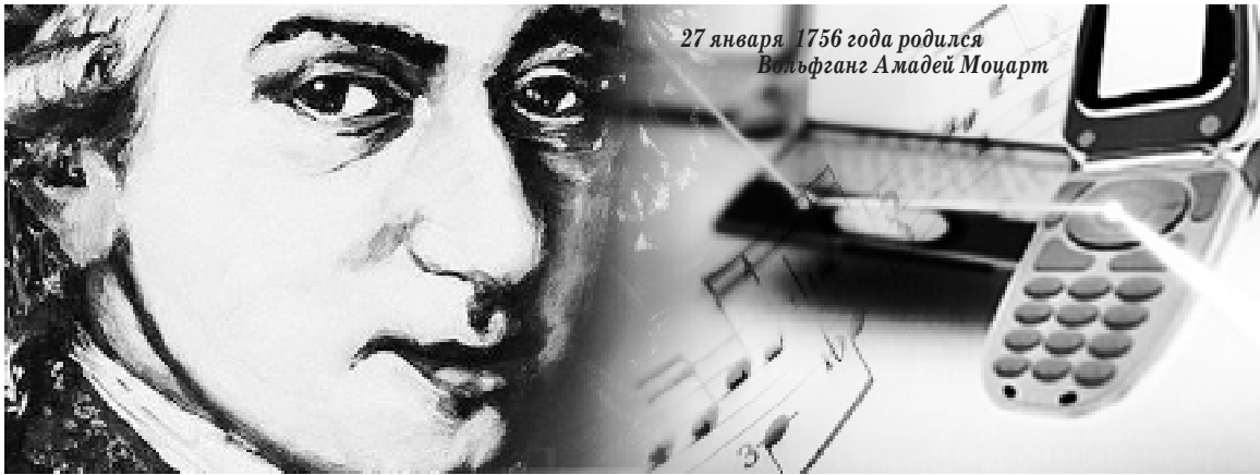
27 января 1756 года родился Вольфганг Амадей Моцарт

О Моцарте нам известны две вещи: во-первых — его убил Сальери, и во-вторых — он написал потрясающие мелодии для мобильных телефонов. Еще вспоминается фильм «Сибирский цирюльник», где сержант О’Лири, по кличке «Бешеный пес», был-таки вынужден признать, что «Моцарт — великий композитор».